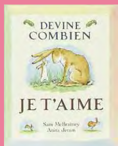
Devine combien je t'aime de S.McBratney et A.Jeram