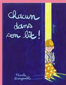
Chacun dans son lit de P. Bougeault