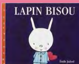
Lapin bisou de E.Jaboul