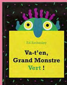
Va-t'en grand monstre vert ! de E.Emberley