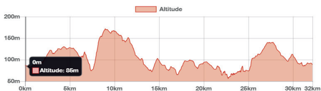
Profil du circuit

Au départ d'Aquabaie : un circuit d'une trentaine de kilomètres passe par la Chapelle du Créac'h à Tréguieux et sa descente rapide (attention aux chutes en cas de pluie). Le circuit présente deux difficultés qui vous mettront dans le rouge avec la côte de Magenta et la ville Calmet. Portez une attention particulière en descendant vers l'Urne avec son chemin accidenté. Cette boucle est ludique. A chaque fois que vous allez faire ce circuit, il y a quelque chose de nouveau... à faire et à refaire.