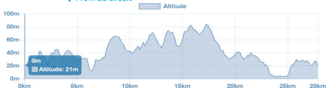
Profil du circuit

Office de tourisme Baie de Saint-Brieuc 02 96 33 32 50 Circuits téléchargeables sur baiedesaintbrieuc.com